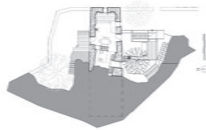
Plan nivel intermediar / Middle floor plan