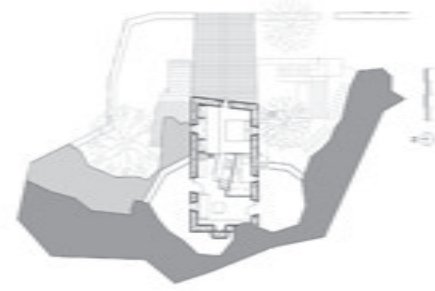
Plan nivel superior / Upper floor plan